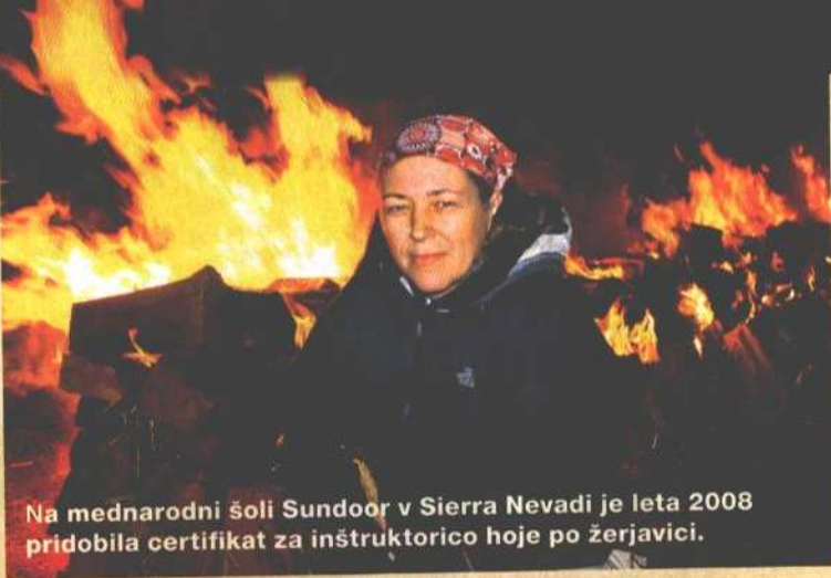
Na mednarodni šoli Sundoor v Sierra Nevadi je leta 2008 pridobila certifikat za inštruktorico hoje po žerjavici.

Zadnjič sem bila na seji sveta za inovativno družbo v državnem svetu in imeli smo diametralno nasprotno pogled na to, kakšno je stanje v Sloveniji. Nekateri so trdili, da je vse v razsulu, da je razpadel sistem družinskih vrednot, da nič ne funkcionira. Sama vidim stvari res povsem drugače. Okoli mene vse brsti, se razvija, je prodorno. Dva popolnoma različna pogleda torej, resnica pa je verjetno nekje vmes. Ampak trenutno gre zagotovo za svet, ko se novo močno spopada s starim, upam le, da bo pri tem prevladala modrost in ne bo prišlo do kakšnih večjih konfliktov ter razkorakov. Zato smo tudi začeli gibanje za inovativni preboj, s katerim skušamo prodreti do vseh struktur v Sloveniji, čedalje bolj pa nam s tem konceptom uspeva prodirati tudi v tujini. Gre za to, da je ustvarjalnost tisto, kar človeka